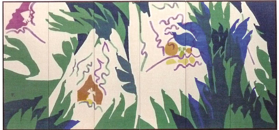
西嶋 武司「無二山上有花風来園」 六曲一雙

染・清流館は現代の染色美術の作品を展示しています。畳敷きの展示室で染めの美をゆっくりとご鑑賞いただけます。